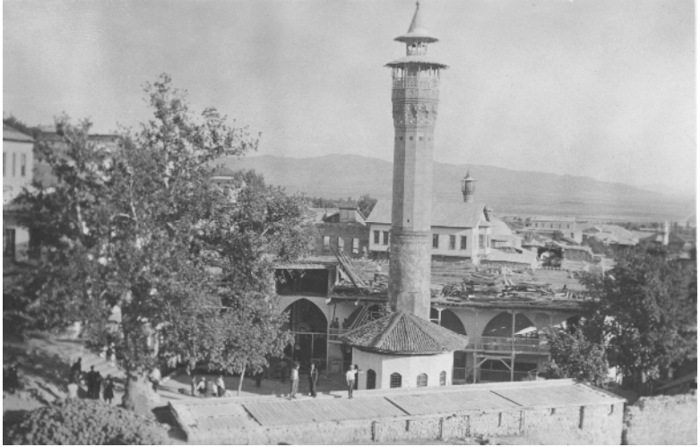
Dulkadirođlu Süleyman Bey'in Yaptırıp Alaüddevlle Bey'in Geliřtirdiđi Ulu Camii