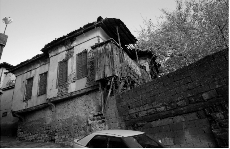
Dulkadirođlu Süleyman Beyin Bugüne İntikal Eden Konađı