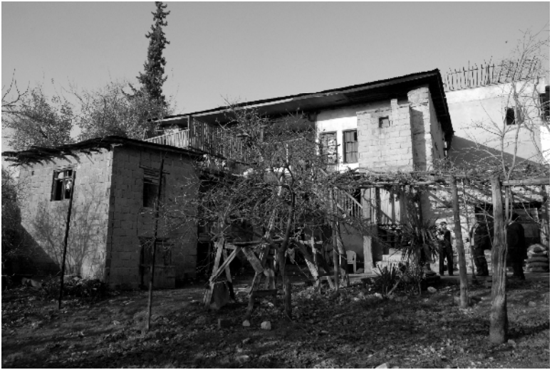
Dulkadirođulları Ailesinden Bugüne İntikal Eden Bir Konak