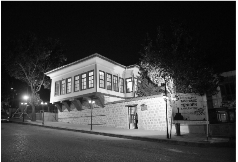
Bayazıdı Ailesinden Arifi Paşa'nın Yaptırdığı Konağın Restore Edilmiş Hali