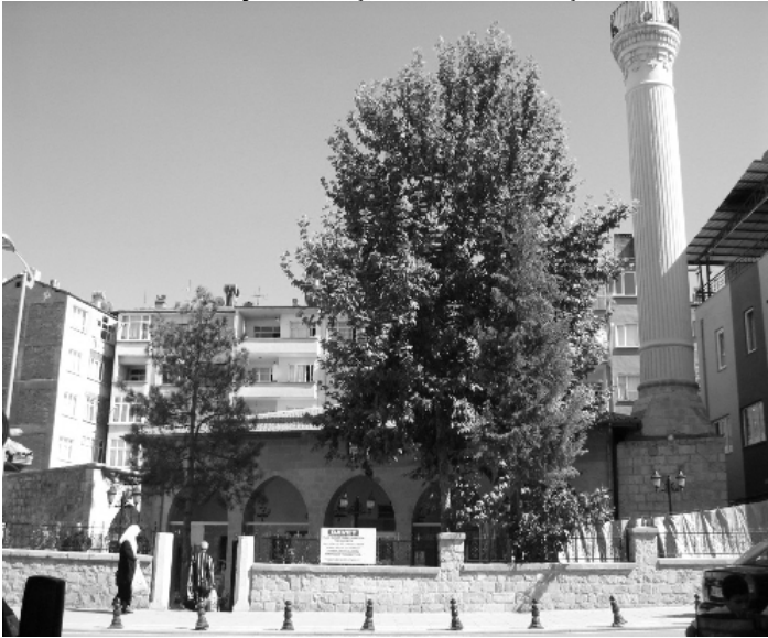
Süleyman Paşa'nın Mezarının Bulunduğu Yusuf Ziya Paşa Camii (Malatya)