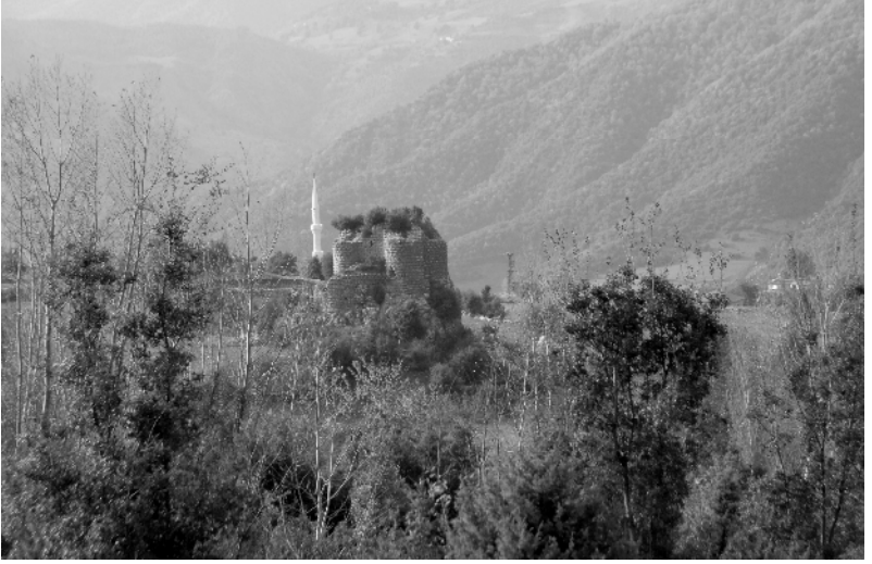
Bayazıdı Ailesinin Ağırıklı Bulunduğu, Hakim Olduğu Andırın Bölgesinden Bir Görünüm