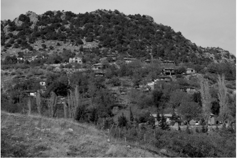
Bayazıdı Ailesinin Yazlıklarının Bulunduđu Yenicekale K y n n Bug nk  G r n m 