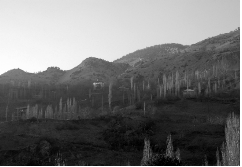
Bulank Köyü içinde Dulkadiroğulları Yurtlarının Bulunduğu Alımpınarı Mevkii