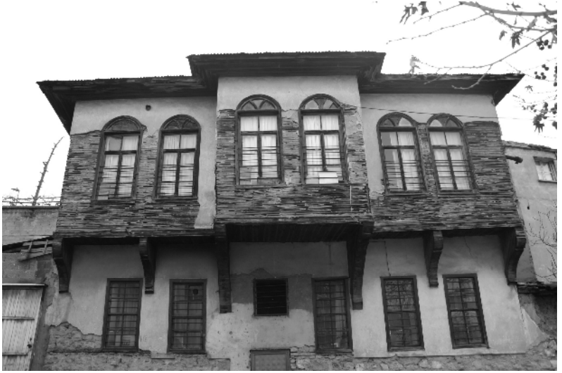
Bayazıdli ailesinin bugüne intikal eden Sarayönü'ndeki konaklarından biri