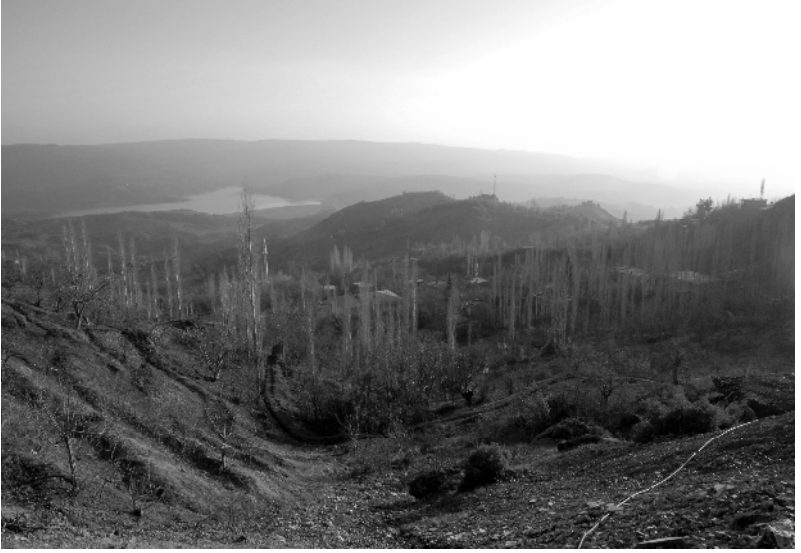
Dulkadiroğulları Yurtlarının Bulunduğu Bulank Köyü