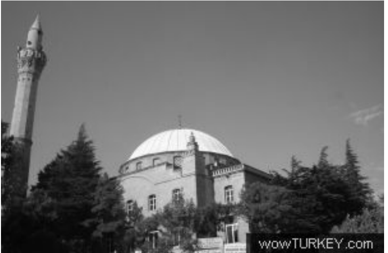
Evvelen Bayazıdlı Ailesi Tarafından Yapılıp Zahiresinde Bayazıdlı Ailesinin Mezarlarının da Bulunduğu Bayazıdlı Camii