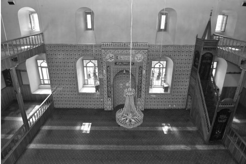
Duraklı (Atoluđu) Câmiinin iç kısmının bugünkü hali