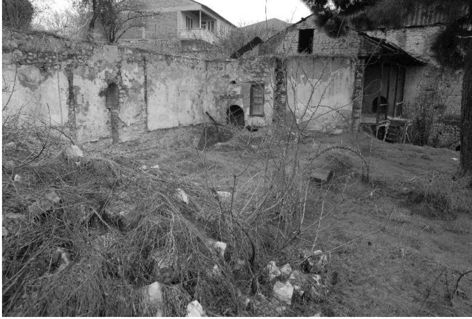
Ermeni evlerinin içinde en muhkemi olan Bulgurcu'nun evinin bugüne intikal eden yıkılmış ve kalan parçaları

Düşmanın top ateşiyle şark cephesini bombardıman etmesi, evlerin yıkılması, telefatin fazlalığı bu mıntıkada halkın maneviyatını iyice sarmıştı. Kadın, çocuk, hasta ve yaşlıların şehirden çıkarılması, köylere gönderilmesi kararlaştırıldı.