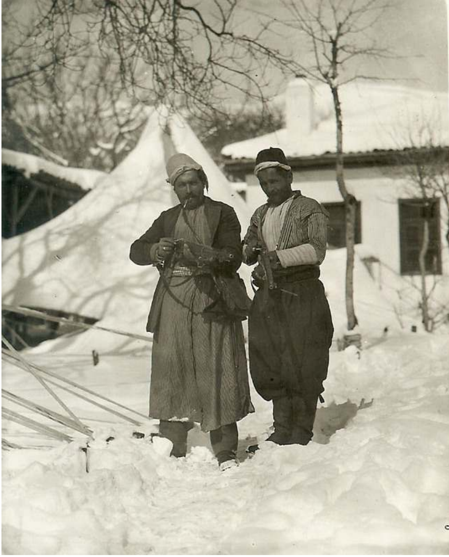
Maraş harbi dönemi çeteleri