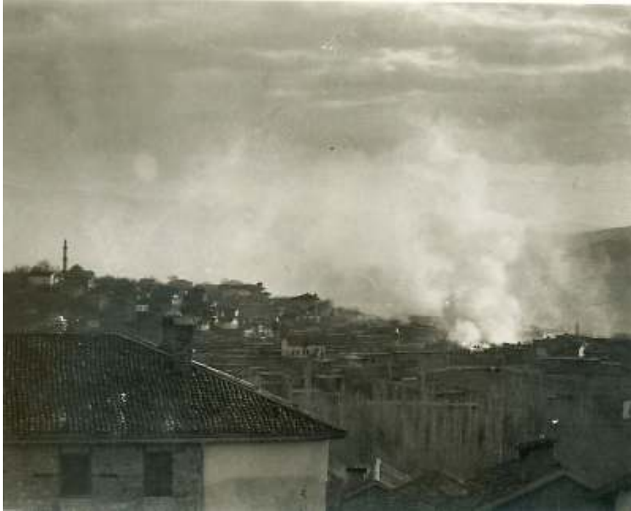
Harpte yanan Maraş'tan bir sahne

-“Kuvvet göndermezden evvel bir zabıt ile beraber gidelim vaziyeti görüp hareket edelim. Siz de ona göre tertibat alabilirsiniz” dedi.