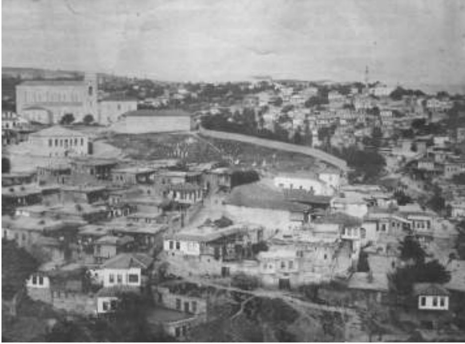
Maraş harbinde en önemli müstahkem mevki': Abarabaşı Kilisesi