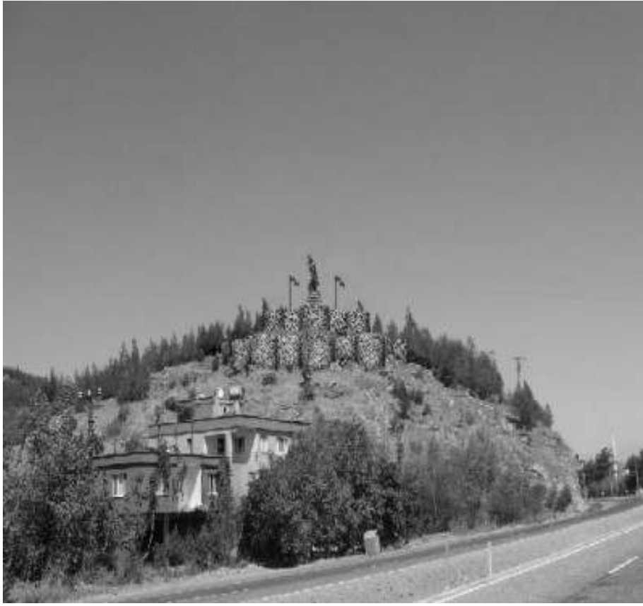
Maraş harbi öncesi ilk çatışmaların yaşandığı yerlerden biri olan Bababurnu'nun bugünkü anıt görünümü