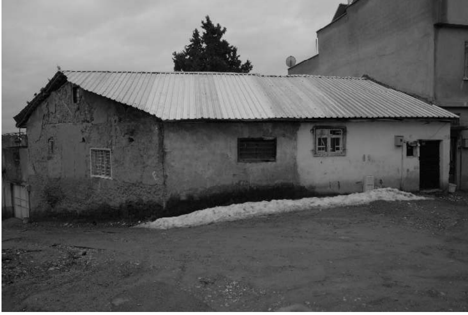
Kümbet Kilisesinin bugünkü bulunduğu mevki

İşte Maraş'ta muhabereyi Türkler ruh hâleti içinde yapıyordu. Fakat son günlerde vaziyet ciddiye kesbetmekteydi. Büyük kahramanların çoğu şehit olmuş, düşman içten mukavemet ediyor, dıştan takviye olarak baskıya hazırlanıyordu. Muharebenin daha uzun süreceği tahmin ediliyordu. Herkes susmuş, bakışlar düşünceli kalpler hincini alamayan arslanların yırtınışını andıran bir huzursuzlukla çarpıyordu.