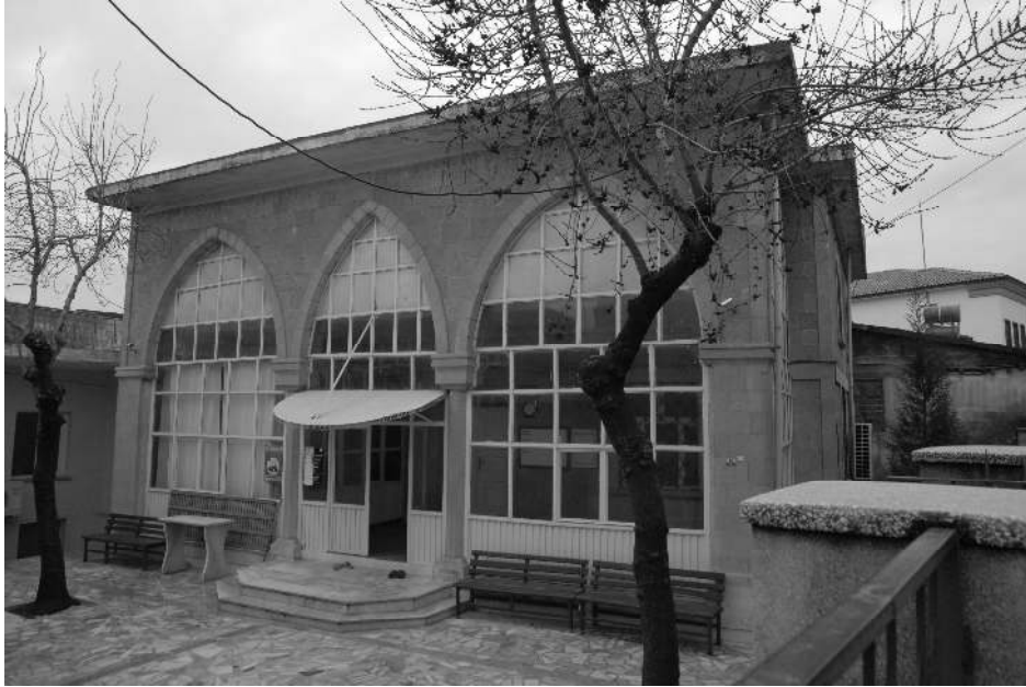
İlk Kuvay-ı Milliye'nin hücrelerinde kurulduğu Çiçekli Camii'nin bugünkü hali

-“Sen ne karışyorsun” diyerek mani olmak istemiştir.