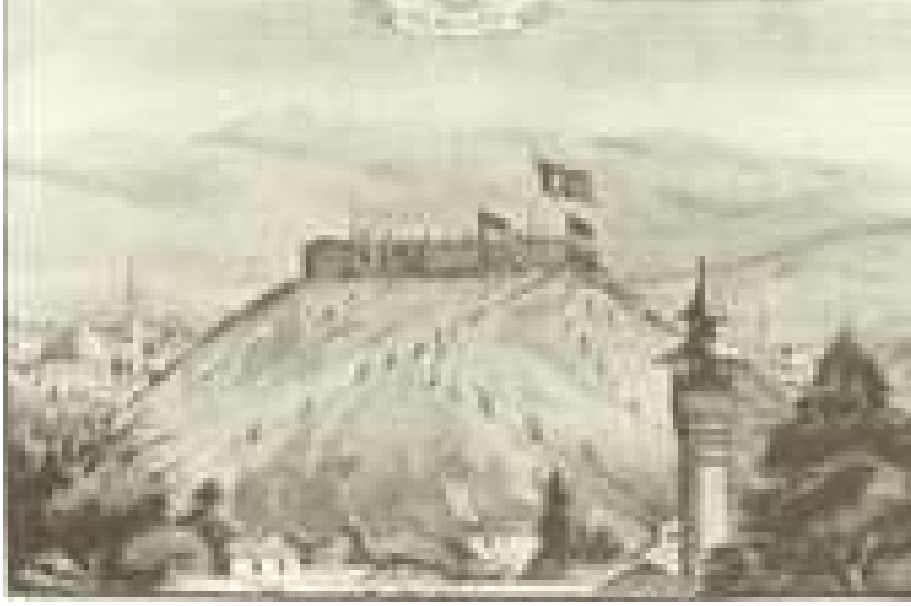
Bayrak hadisesinin temsili resmi