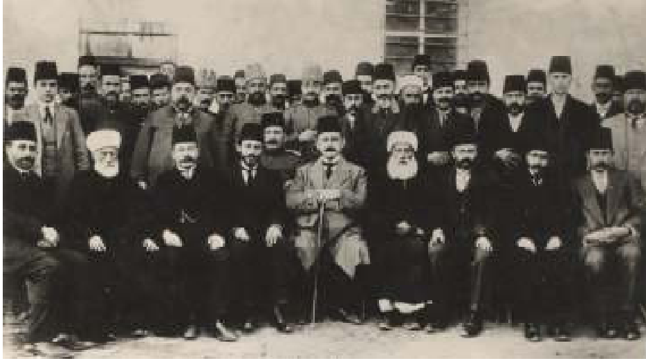
Maraş Kuvay-ı Milliyecilerinin toplu bir resmi