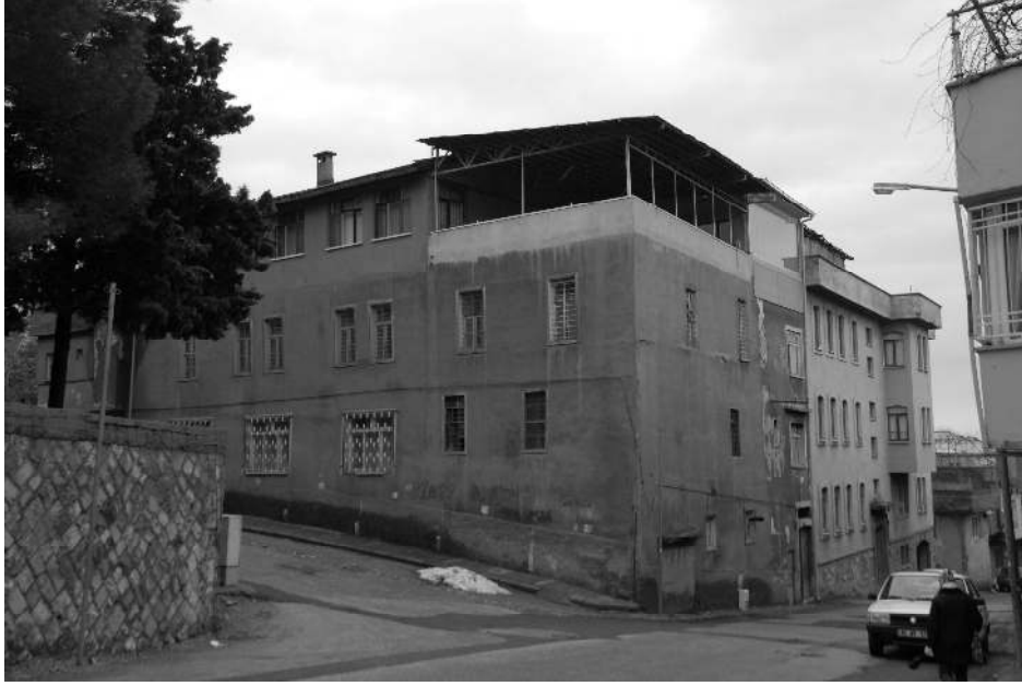
Alman Eytamhanesinin bugünkü bulunduğu mevki