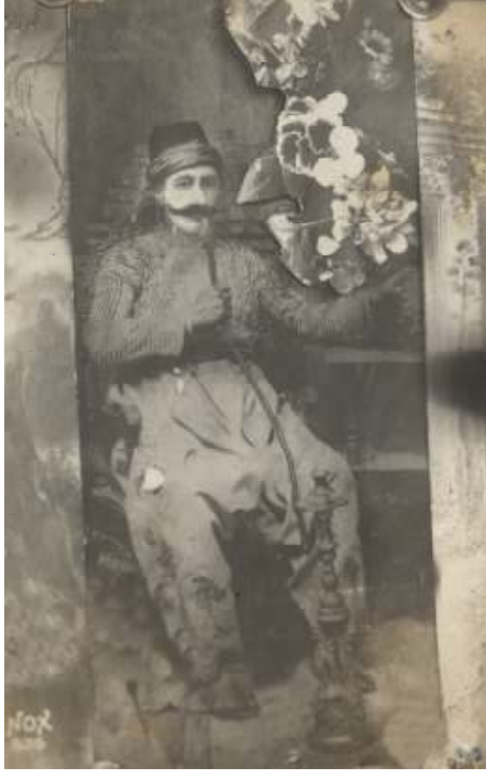
Maraş harbinin unutulmaz kahramanı Millîş Nuri

-Senin üstündeki elbise ve belindeki tabanca nedir? Türk çocuklarına caka sat diye bunu sana anan mı verdi? Niçin ölmedin? Niçin öldürmedin? Beşini ben öldürdüm. Gerisini de sen öldür de büyüsün. Seni öldürmeli.