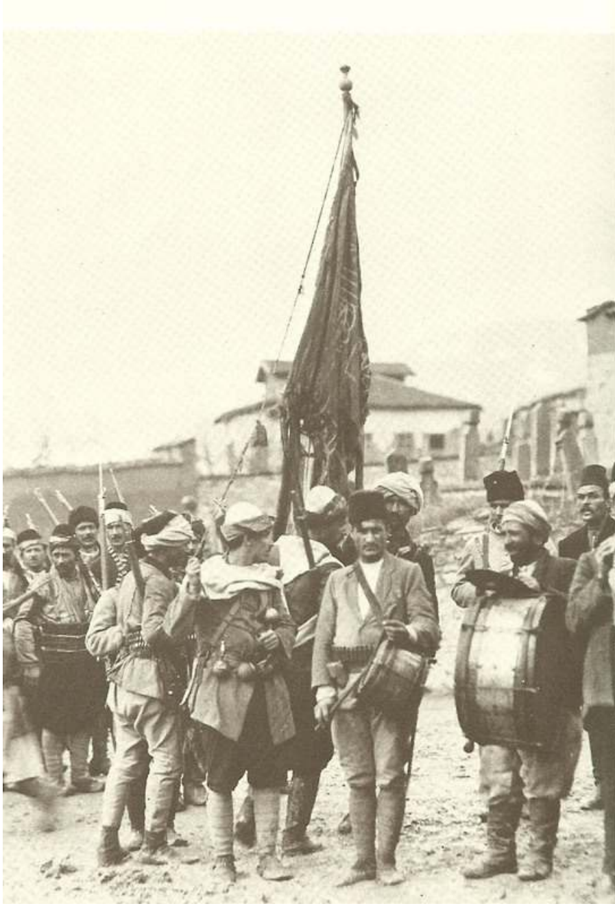
Düşmanı kovan Maraşlının bayram sevinci