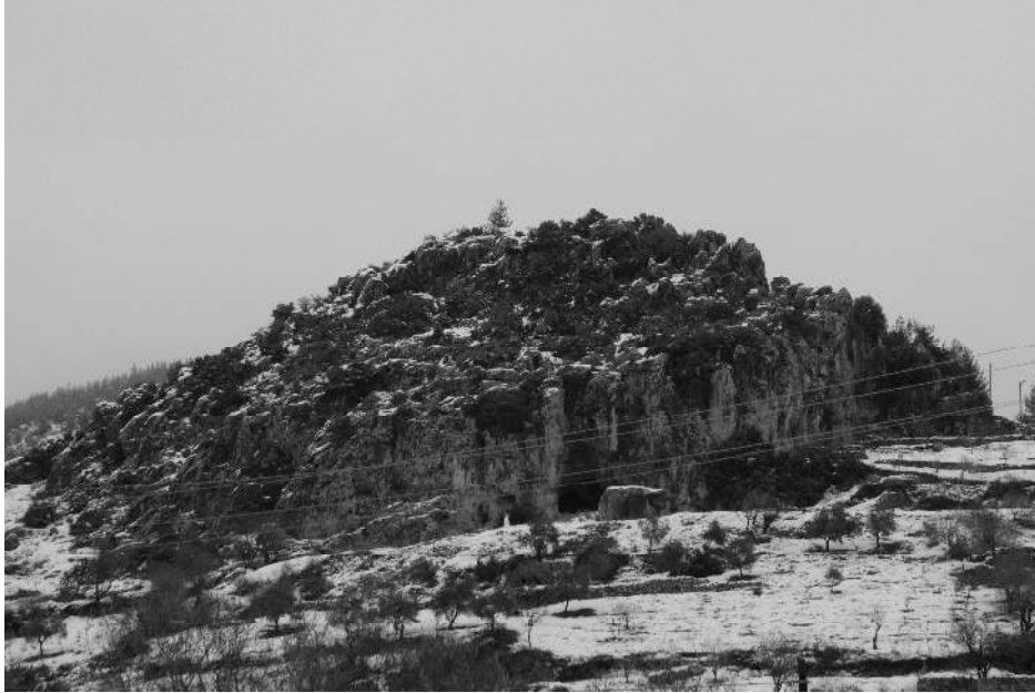
Maraş harbinde dışarıdan gelen çetelerin en çok kullandığı mekan: Cancık Mağarası