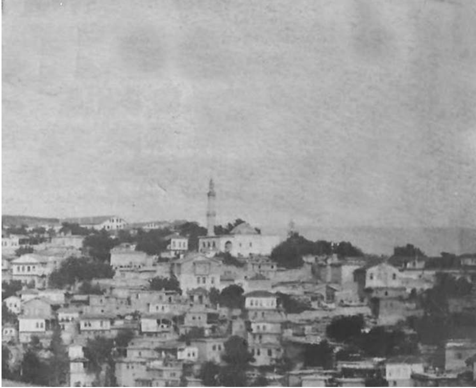
Eski Maraş'ta Divanlı (Doğanlı) mahallesinden bir görünüm

Not: Bu tutanaktan anlamı temâmen kaybolmuş ve bir şey anlaşılmayan posta şifrelerini havi on satırlık bir kısım çıkarılmıştır.