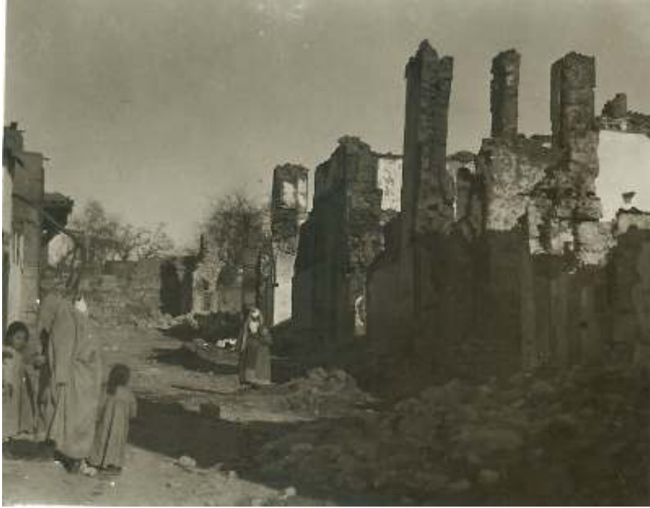
Harp sonrası tahrip olmuş Maraş'tan bir sahne