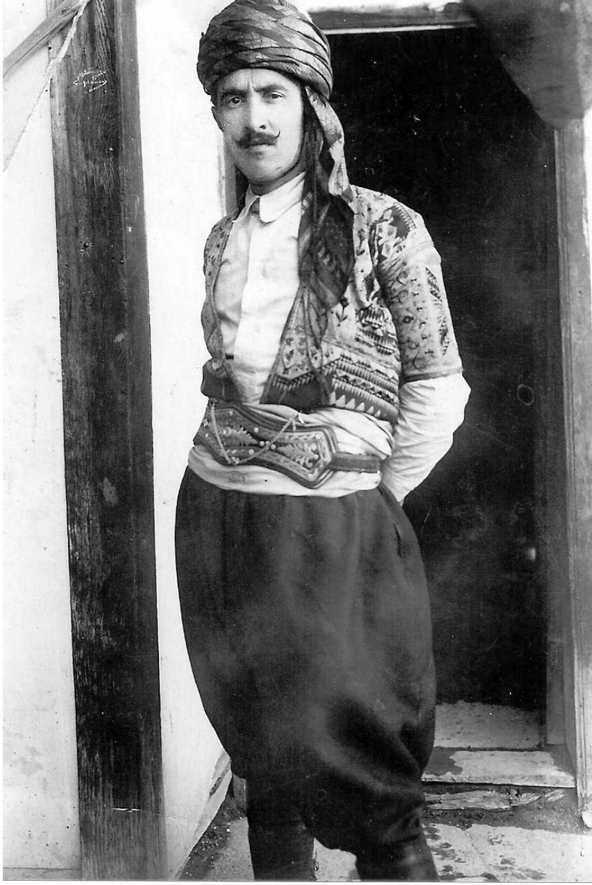
Maraş harbine adını verdiren bir çete resmi