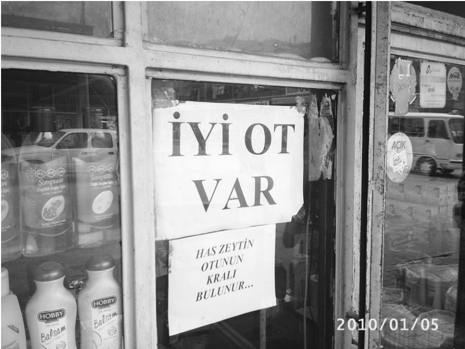
Ot satan bir bakkal

Maraş'ta bir de enfiye kullanımı yaygındır. Enfiye kullanımı tiryakilik olduğu gibi sağlığa yararı olduğu kabul edilerek de kullanılır. Enfiye burna çekildiğinde insan hapşırır, hapşırınca burunda, genizde akıntı olur bu da insanın üst solunum yollarının temizlenmesi, rahatlaması olarak kabul edilir. Baş ağrısının enfiye kullanımı ile giderildiği kabul edilir.