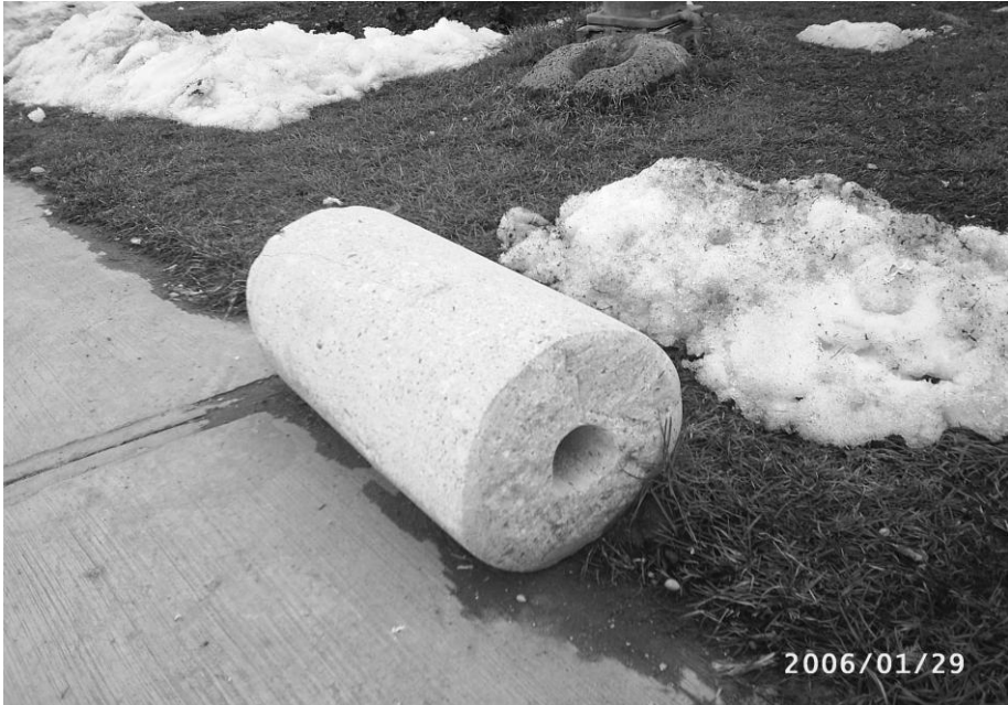
Antika olmuş bir lov

Her semtte birkaç lovcu olur. Lovcular yazın üzerindeki toprağı zayıflamış olan damların topraklarını kazıyarak yerine yeni toprak getirir ve bunları tepeleye tepeleye sıkıştırarak serer. Damın her yanına 20 cm kadar kalınlıkta serdikten sonra hafif sularlar ve lovla üzerinden giderek sıkıştırırlar. İnce toprağı azaldığı için geçirgen hâle gelmiş toprağa ince toprak ilavesi yapılır. Serilen bu yeni killi topraklar yağmurda suyu aşağı vermez.