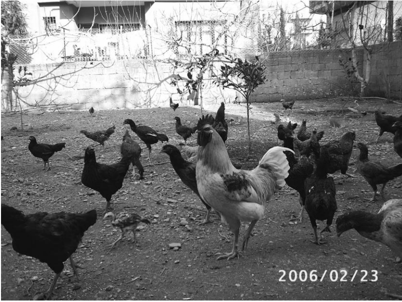
Tavuklar ve horoz

Eski Maraş'ta pek çok evde keçi beslenir. Her evde bir iki keçi bulunur, bunların sütü, günlük yoğurdu, tarhanalık yoğurdu, taze yağı o aileye yeter. Kurban Bayramına birkaç ay kala bir kısım Maraşlı oğlak veya kuzu alarak evinde besler, bayramda kurban eder. Bazıları inek veya o yıllarda Maraş'ta çok olan manda (camız) besler. Süt için beslenen davar ve sığırlar sabahleyin erkenden mahalle meydanında veya nahır toplama mermezinde çobana teslim edilir, akşamüzeri yazıdan çobanla dönen hayvanlar evlerine gelir. Her hayvanı evde bekleyen yavrusu olduğundan dönüşte şaşırmadan evi bulur.