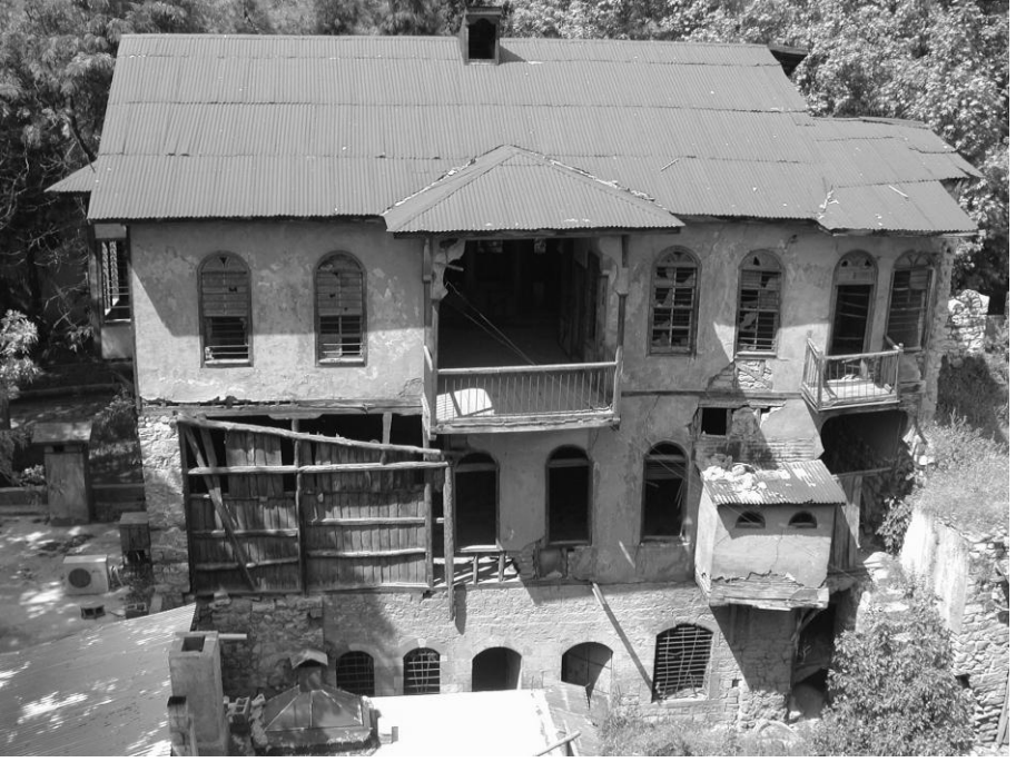
Bir dönem Maraş'ta misafirlerin konaklama ihtiyacını karşılayan ve otellerin yerini tutan hanlardan bir örnek