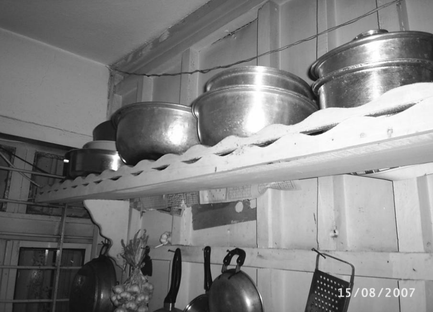
Raflarda kalaylı bakır kaplar

Her evde turşu ceresi vardır. Turşu cereleri sırsız olur. Vurulan turşular mutfağa yakın yerde bulundurulur. Yağlar, peynirler sırlı cerelerde ve evin daha serin yerinde muhafaza edilir. Zeytinyağı tenekelerde saklanır. İhtiyaç duyuldukça yağ depmelerine alınır. Tenekede duran zeytinyağı tortunu bırakarak daha da saflaşır ve kalitesi artar.