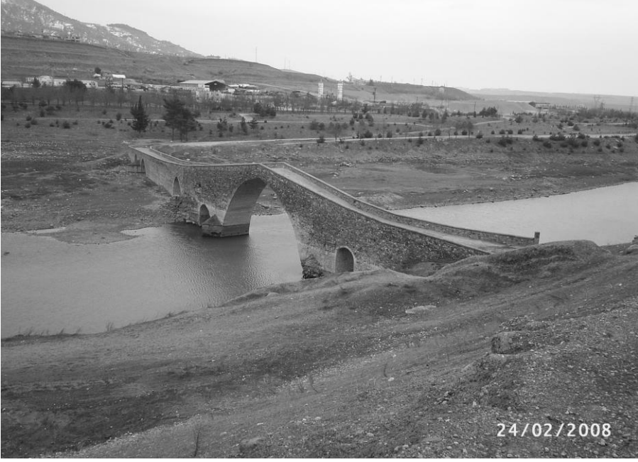
Kılavuzlu Köyünde Kemer Köprü

Aileler yiyeceklerini yanlarına alarak, deyim yerindeyse etlerini ekmeklerini yanlarına alarak pikniğe gider. Piknikte ağırlıklı olarak kuşbaşı kebab yapılır. Bazen patlıcan kebabı, kıyma kebabı, pırzola da yapıldığı da olur. Kebabın dışında çiğköfte de yapıldığı olur.