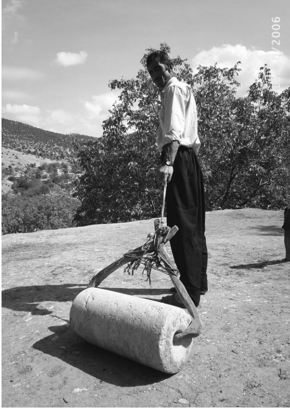
Dam lovlayan lovcu

Lov, 60 cm kadar uzunlukta, 25-30 cm apında tařtan yapılma bir silindir olup silindirin iki yanında lov ađacının cck denilen ıkıntılarının gireceđi birer oyuk olur. Lov ađacının ccđ buraya girer, lovcu lov ađacını ektike lov da peři sıra gelir. Bylelikle btn dam yavař yavař lovlanır. En sonunda lov yaklařtırmanın zor ve tehlikeli olduđu dam uları (syk) tokalanarak sıkılařtırılır. Kimi acemi lovcuların, kenarları lovlarken lovu ařađı dřrdkleri olur. Tokalar genellikle ınardan yapılır. 50 cm kadar uzunlukta ve krek sapına benzer bir sapı, geniř ve kalın bir tabanı olan kaba kısmı olur. amařır yıkamada da kullanılan tokaların sapından tutularak kalın kaba kısmı ile sykler (dam kenarları) sıkıřtırılır.