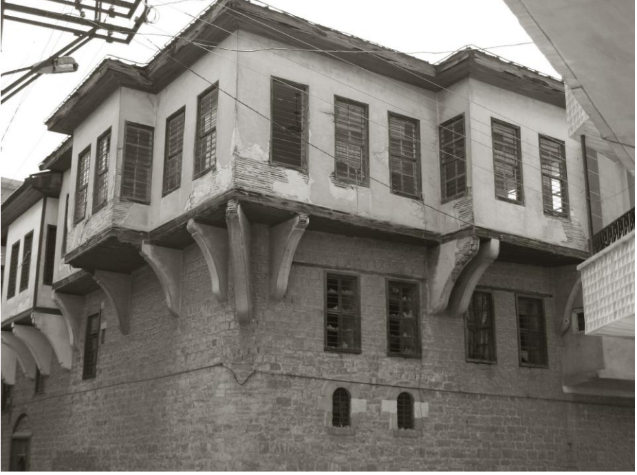
Zenginleşen Maraş'ta dam evden konağa geçişi temsil eden bir konak