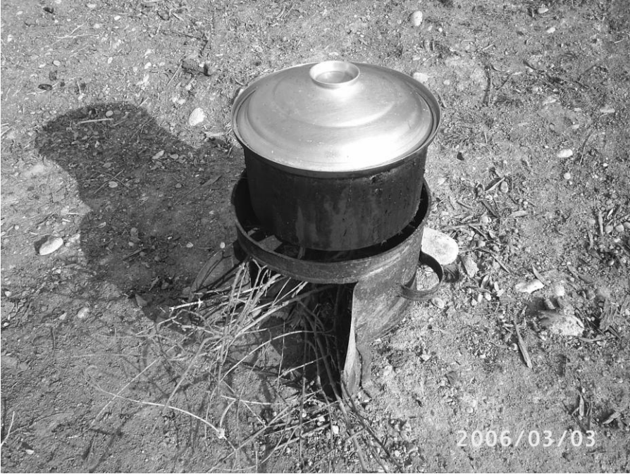
Tenekeden yapılan ocak

Evin erkeği sabahleyin işe giderken karı koca akşama ne yapılacağına kararlaştırır, erkek eve bu ihtiyaçları gönderir veya getirir.