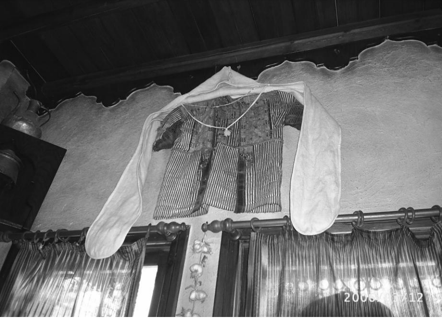
Aba ve börkenek

şalvarın uçkurunu gevşetip sıkıştırarak ayar yapar. Şalvarın üzerinden veya altından kuşak bağlanır. Kuşak, ağır kaldıranların belinin incinmesini önler. Böbreklerin üşümesini önler. Şalvarın altından ayak bileğine kadar ve burada düğmesi olan uzun bir don giyilir. Üstten köynek denilen kollu bir fanila giyilir, bunun üzerinden de gömlek giyilir. Kışın aba giyilir, soğuk günlerde hem başlık hem de atkı görevini yapan börkenek bağlanır. Ayaklara yün çorap ve yemeni (zenginler kundura) edik, postal giyilir. Daha eskiler üç etek zubun giyer.