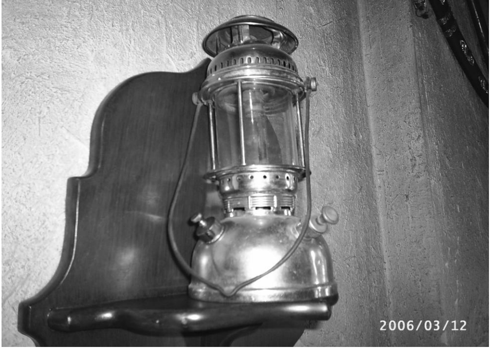
Zengin ailelerin aydınlatmada kullandığı lüks

Ramazanlarda bazı camilerin minarelerinin şerefesinde kandil yakıldığı olur.