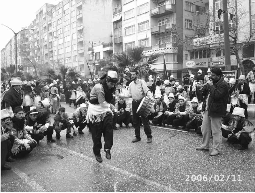
Davul zurna eşliğinde oyun oynayan çeteler

durumu yerinde olan ağalar mahallelerindeki çetelere her gün yemek hazırlar.