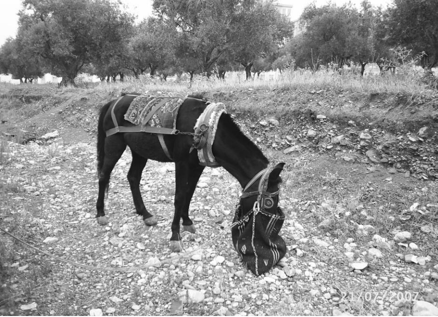
Yem yiyen at

Davar ve sıđırlar evlerin alt katındaki ahırlarda beslenir. Bunları beslemek iin mevsiminde saman, arpa zavarı (deđerimende kırılmıř arpa) ve kepek alınır. Yemek atıklarının bir tek kırıntısı bile pe gitmez, ařađıdaki hayvanlara verilir. Sebze atıklarını davar ve sıđırlar, taneli atıkları tavuklar, et ve kemik atıklarını kediler ve kpekler yer.