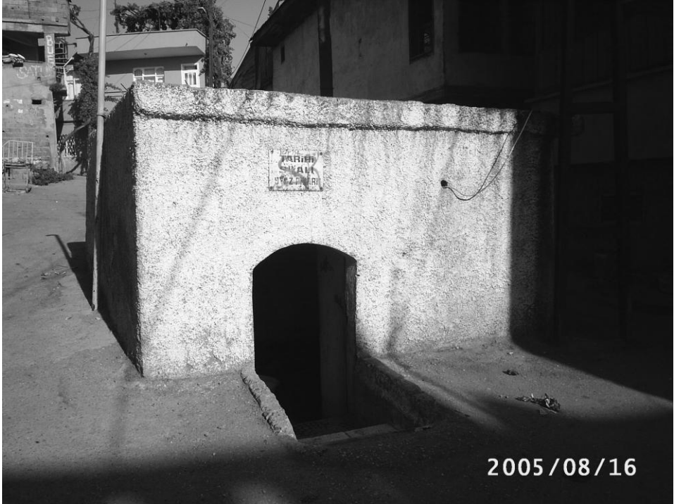
Uyuz Pınarının eski hâli.