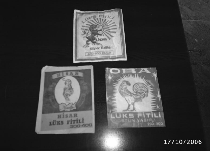
Çeşitli marka lüks fitilleri