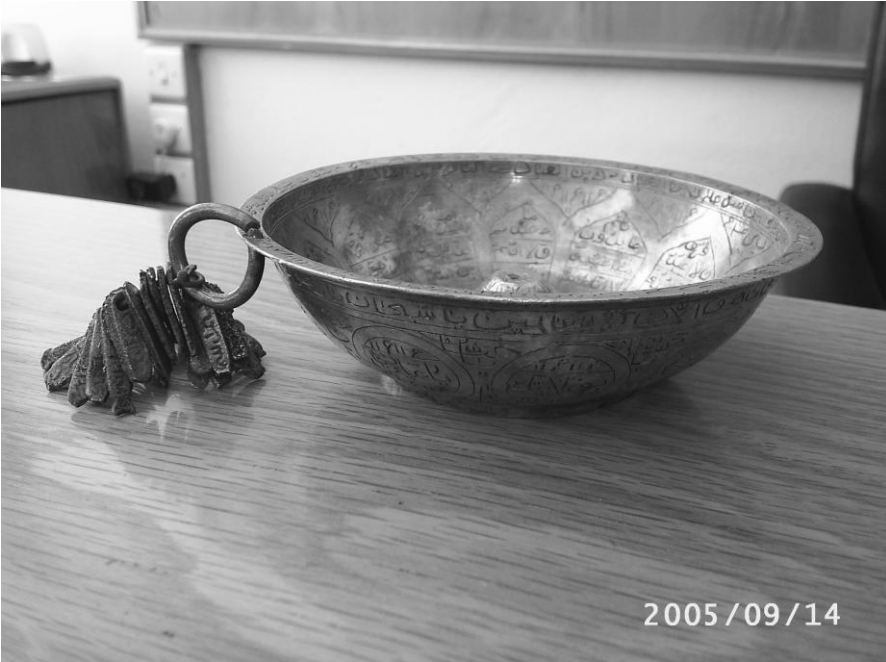
Uyuz Pınarının tılsımlı tası.

Bu tas şimdi Ahmet Ağcakala'da bulunmaktadır. Uyuz gibi bir cilt hastalığına yakalanan Ahmet Ağcakala'dan tası ödünç alır, kaç defa yıkanması salık verilmişse o kadar yıkandıktan sonra tası iade eder. Tasın üzerinde eski harflerle yazılmış yazılar bulunmaktadır.