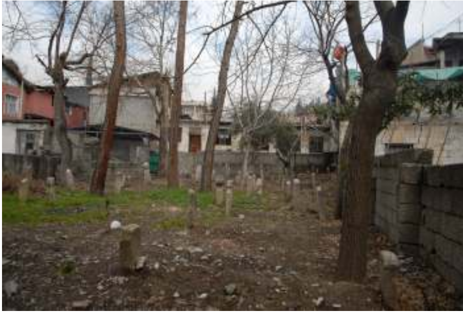
Seyyid Mustafa Bey tarafından yaptırılan Bey Camii'nin önündeki Dulkadirli ailesine mahsus aile mezarlığı