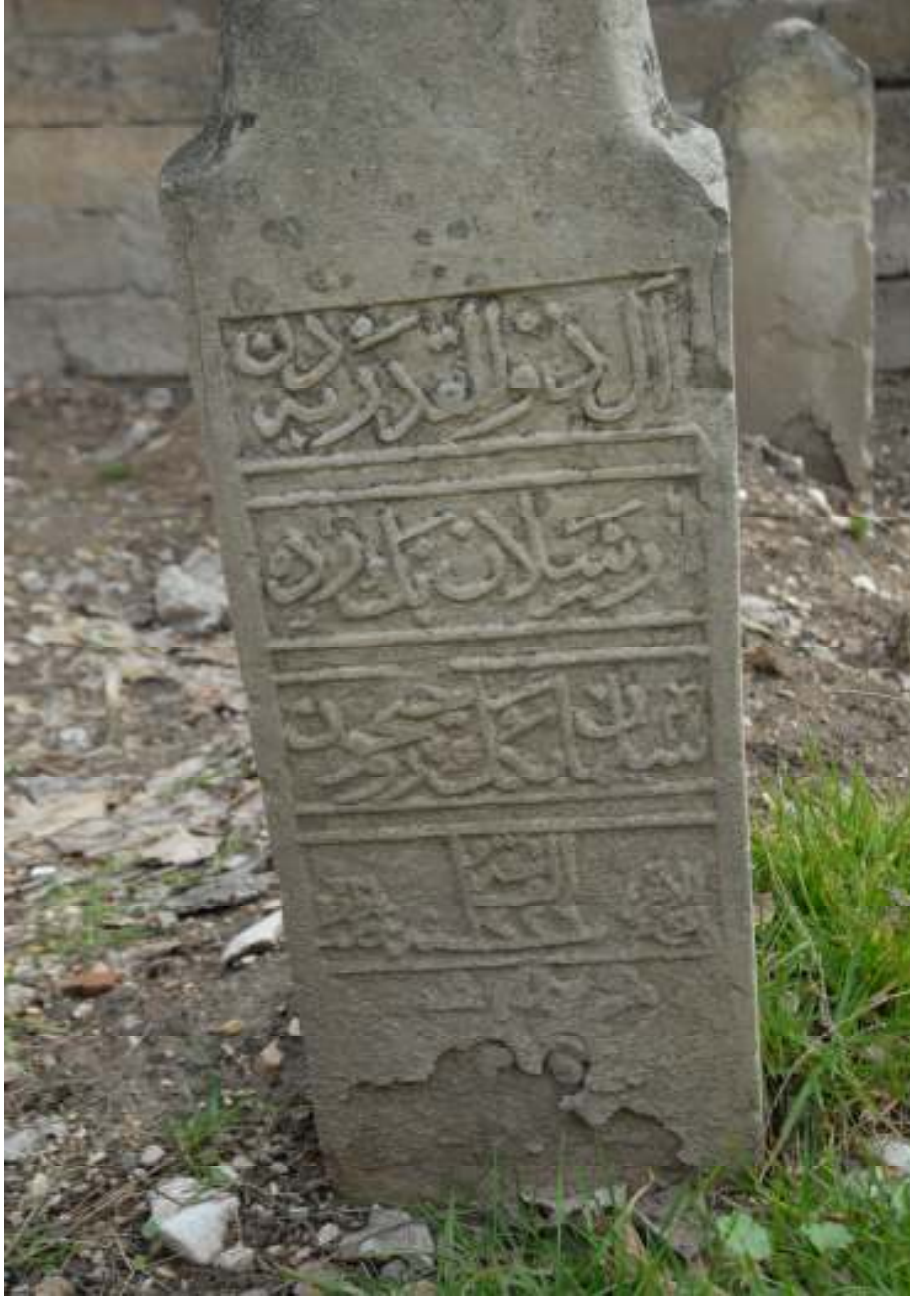
Bey Camii önündeki Dulkadirli aile mezarlığındaki bir mezar taşı. Mezar taşındaki yazı (Âl-i Zülkadiyeden Arslan beyzâde Süleyman Beyin ruhu için 1226 zilkade)